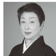
水木佑歌(みずき ゆか)

横浜市生まれ。1987年日本舞踊協会新春舞踊大会1位・文部大臣奨励賞、2003年松尾芸能賞新人賞、2007年文化庁芸術祭優秀賞など受賞。